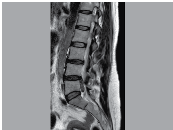
Figura 2. Exemplo de ressonância magnética corte sagital ponderada em T2 com hérnia lombar migrada, Zona 4.

Excluí-se pacientes com cirurgia prévia da coluna lombar ou que tivessem outra doença no segmento em análise.